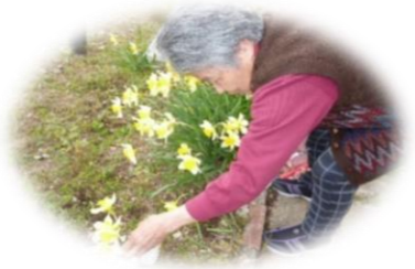
お風呂・食事、喫茶店での談笑など。 多彩なイベントにて、お楽しみくださいませ！！