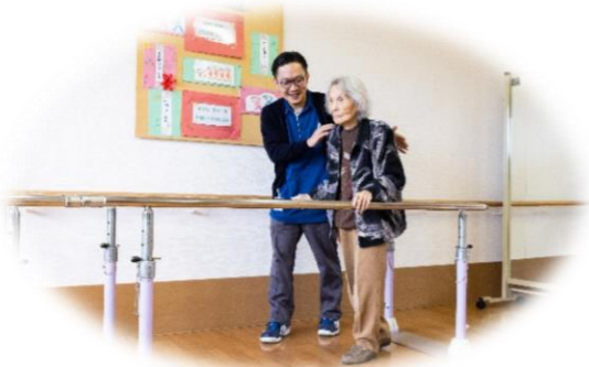
理学療法士等による「リハビリ」